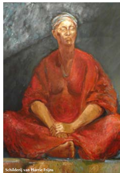
Schilderij van Harrie Frijns